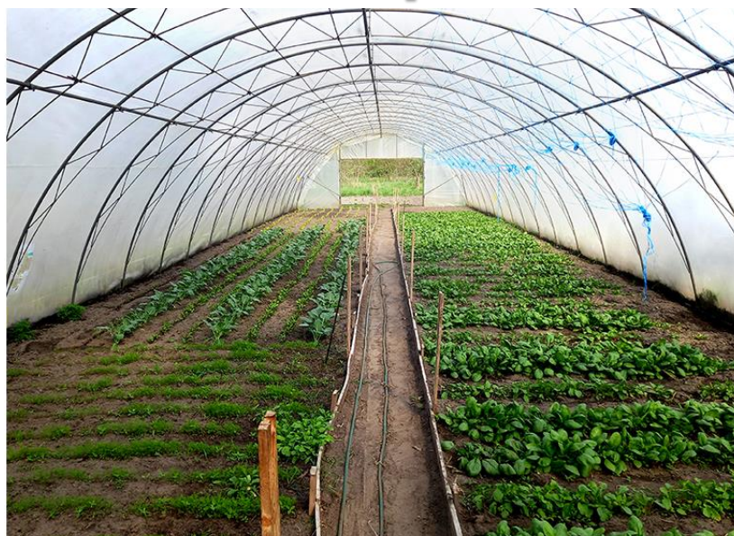
Ekologiczne Gospodarstwo Społeczno-Opiekuńcze